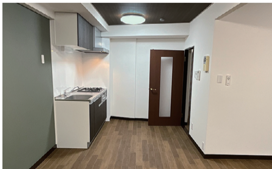
色による空間イメージの違い